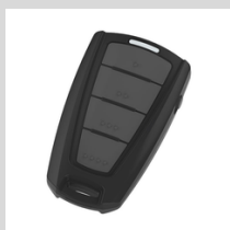
Tay điều khiển 4 kênh PR-4

Tay điều khiển cầm tay từ xa 4 kênh PR-4: