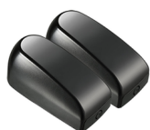
Cảm biến an toàn PH6 (Photocell)